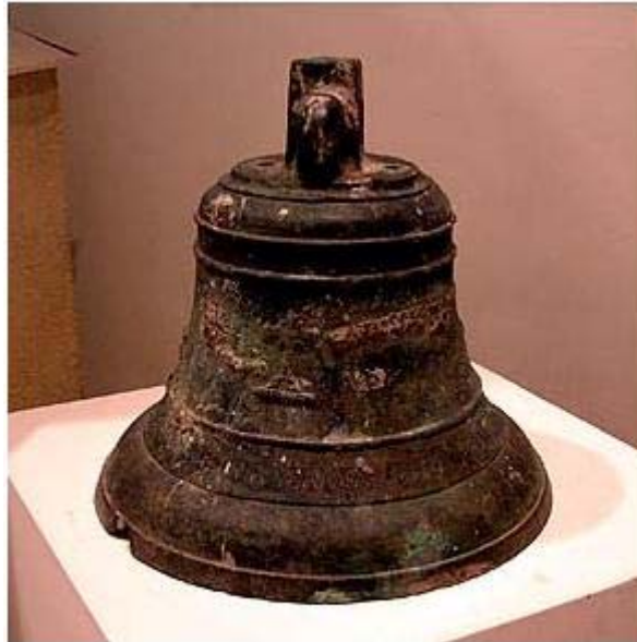
شکل ۴. زنگ کلیسایی باستانی متعلق به کشور اسپانیا

در سده های سوم و چهارم پس از میلاد تا قرن چهاردهم میلادی یک دوره رکود در صنایع و از جمله ریخته گری به وجود آمد. البته با توجه به حکومت کلیسا ها و تزئینات آن نظیر ناقوس ، شمعدانی و ... روش های جدیدی در ریخته گری ایجاد شد.