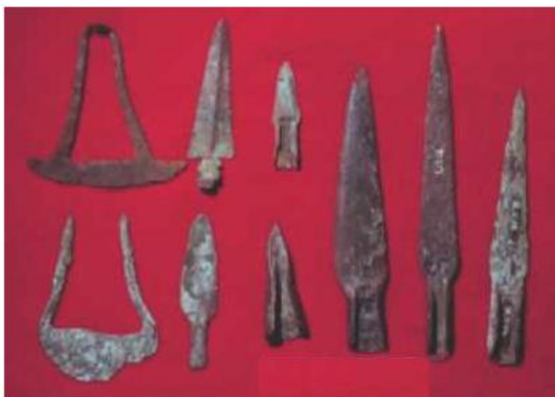
شکل ۱. نمونه هایی از نخستین اشیاء مسی

دوره برنز در خاور نزدیک و در حدود ۳۰۰۰ سال پیش از میلاد مسیح آغاز شد. نخستین اشیای کشف شده به صورت آلیاژی از مس و آرسنیک (حدود ۴ درصد) بوده است. این آلیاژ که مصرف عمومی داشت ، همزمان با خاور نزدیک در اروپا به خصوص انگلستان نیز مورد استفاده قرار گرفت.