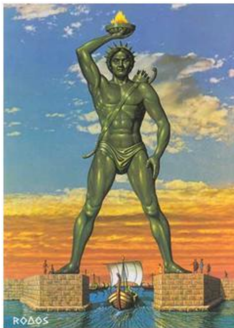
شکل ۳. تصویر مجسمه رودس

از عجایب این دوره ساخت مجسمه رودس است که در سال ۲۹۰ پیش از میلاد ساخته شده و جزء عجایب هفت گانه محسوب می شود. این مجسمه ۳۲ متری که از قطعات مختلف برنز ریخته گری شده و وزنی حدود ۳۹۰ تن داشت طی زمین لرزه ای در دریای مدیترانه غرق شد.